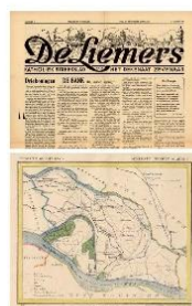
Kranten - Kaarten